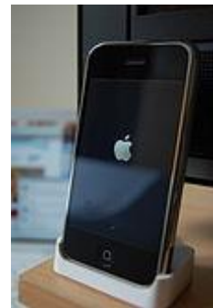
نسل اول آی فون

استیو جابز در مک‌ورلد ژانویه ۲۰۰۷ آی فون را معرفی کرد. جابز گفت: «امروز ما قصد داریم سه نوع محصول انقلابی از این دسته را معرفی کنیم.