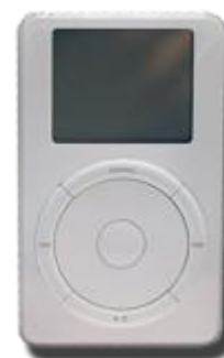
نسل اول آی‌پاد

در پاییز سال ۲۰۰۰، جابز تصمیم گرفت که یک پخش‌کننده موسیقی قابل حمل طراحی کند. جابز که از طرفداران موسیقی به شمار می‌رفت، علاقه خاصی به این پروژه داشت. خواسته اصلی جابز سهولت در استفاده بود. روش او برای تست این سهولت چنین بود: اگر او موسیقی یا عملکردی را می‌خواست، آیا می‌توانست در سه کلیک آن را پخش یا اجرا کند.