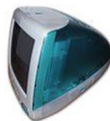
نسل اول آی‌مک

آی‌مک اولین محصولی بود که جایز و جاناتان آیو با همکاری هم آن را طراحی کردند که به موفقیت بزرگی نیز نایل شد. یک رایانه رومیزی با کاربری خانگی که در سال ۱۹۹۸ به بازار عرضه شد. جایز معتقد بود که این محصول، باید یک محصول کامل باشد. محصولی متشکل از کیبورد، مانیتور و کیس، که درست پس از درآوردن از جعبه بتوان آن را روشن و از آن استفاده کرد.